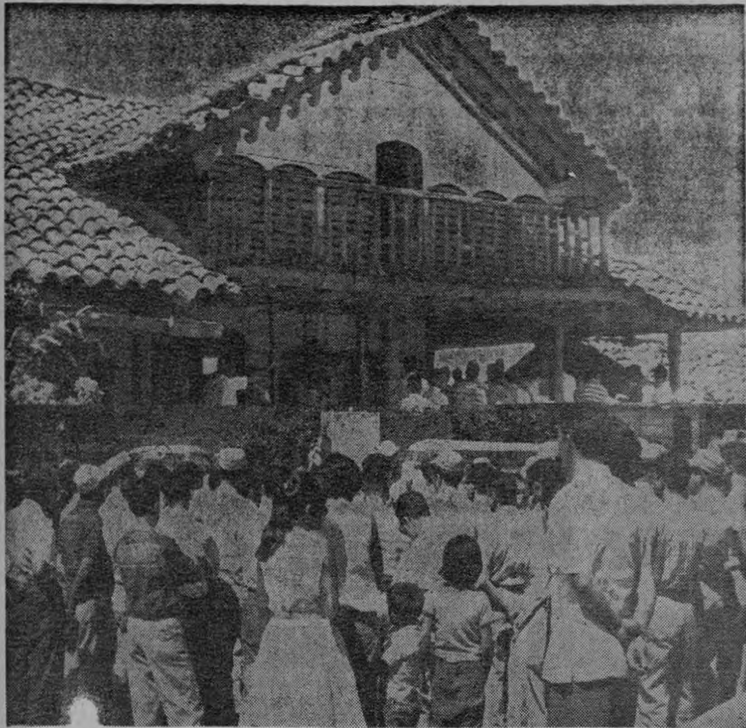
AYER EN SANTA ROSA. — Presentan las gráficas: arriba en la centenario e histórica casona de Santa Rosa parte de los asistentes a una misa ayer recordando a los caídos hace seis años. Abajo en el momento de colocar una ofrenda floral que recuerda a los combatientes.